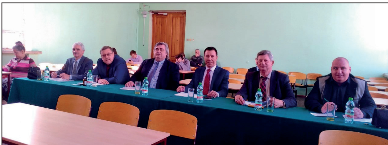
Жюри Всероссийского конкурса исполнителей на народных инструментах имени И. Я. Паницкого

Музыка словно сама рождалась под пальцами музыканта — так естественно и просто он вел диалог с аудиторией. Композитор Исаак Осипович Дунаевский, услышав игру И. Я. Паницкого, писал: «Я готов слушать без конца вашу поэтическую игру. После встречи с Вами баян стал для меня открытием. <...> Все, что Вы, Иван Яковлевич, сделали с моими произведениями, — сделано Вами блестяще. Я разрешаю Вам и в дальнейшем из моей му-